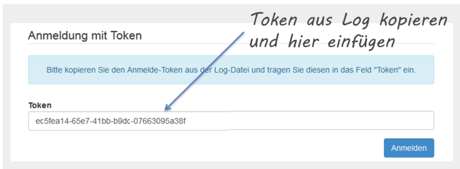
Abbildung 1: MIR-Wizard - Sicherheitsabfrage nach einem Token

Nach Aufruf dieser URL wird der MIR-Wizard gestartet, der wie Abb. 1 zeigt, ein Sicherheits-Token abfragt, das sich im Log des Servletcontainers (z.B. Tomcat-Log, siehe Abb. 2) befindet. Sucht man im Log nach "Login token", findet man die entsprechende Stelle recht schnell. Das Token - eine UUID - muss dann vollständig kopiert und eingefügt werden. Danach kann die Installation beginnen.